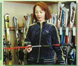
一心不乱に意識集中。ダメなら気合でなんとかするから頼れる大型兵器 宮下センセ