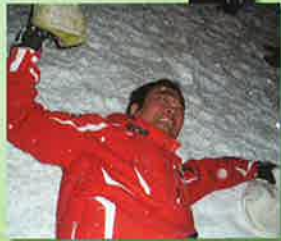
「俺を喜ばせると怖いんだぞう」 宇佐見先生