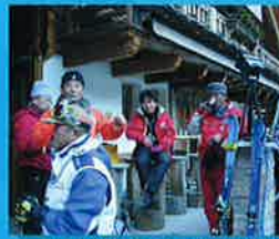
教師の8割が滑ったスキー場だから初めてでも安心

「せっかくのヨーロッパ、スキーだけじゃもったいない!」という方にはオプション観光もアレンジ可能です。