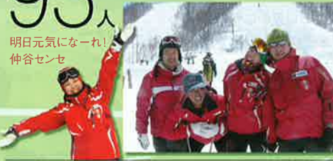
明日元気になる! 仲谷センセ