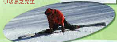
「ウリア、トゥース! タフでなければ生きてはいけない。柔軟でなければ生き延びられない…」