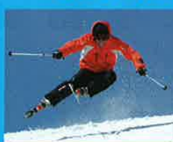
おなじみルティも合流予定