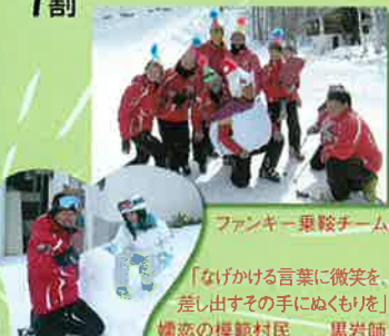
ファンキー乗鞍チーム