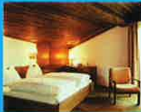
宿泊は、ホテルベルグ。日本人好みの料理が好評