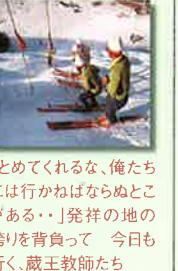
とめてくれるな、俺たちには行かねばならぬところがある…」発祥の地の誇りを背負って 今日も行くと、蔵王教師たち