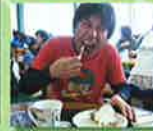
貴広作る人、ボク食べる人。育ち盛りのやんちゃっ子 大類センセ