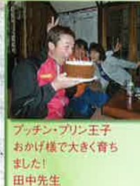
プッチン・プリン王子 おかげ様で大きく育ちました! 田中先生