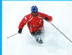
ご一緒するのはナイス教師陣