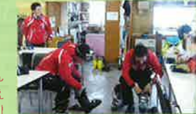
「男はあわてちゃなんねえ、子供からキツク言われてんだ。さ、ポチポチ行くか」出勤準備中の湯の丸教師陣