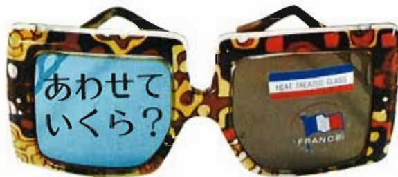
'74 Imported ski goods selection