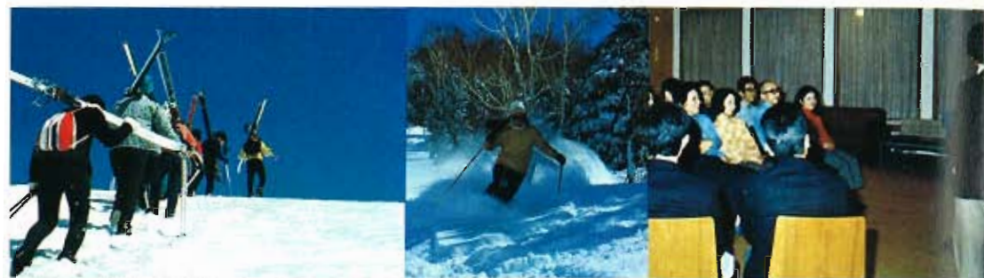
晴天の4日目はゲレンデ・ツアー。技術応用編。