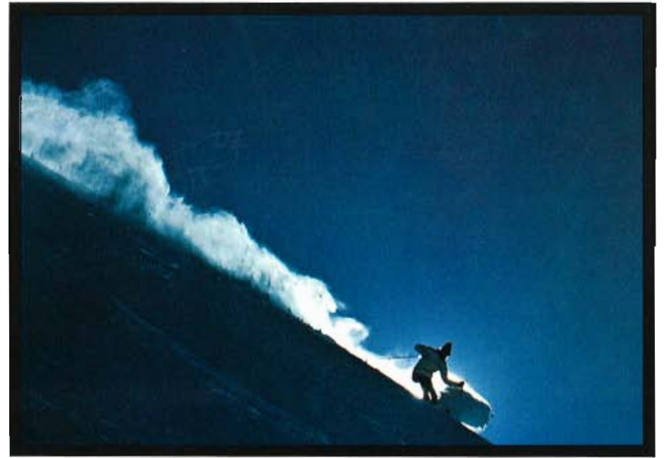
team, left alone