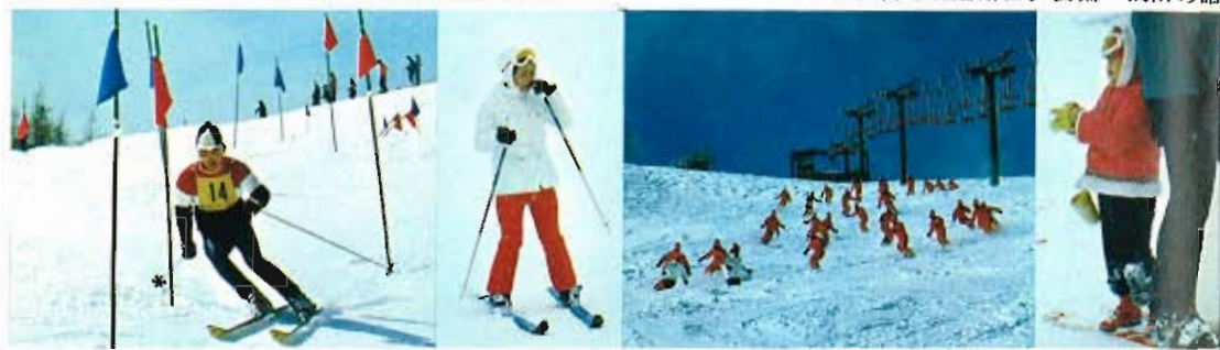
ポール・レッスンも。