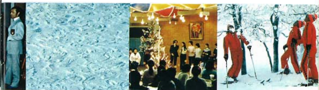
と映画。蔵王はVTRつき。