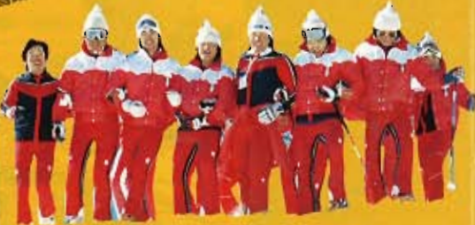
おっやっとなるやっとなる私設チアボーイズ。

人生は降り積もる悲しみを払い落しなが らすむ旅。いつの日か、琥珀色に輝く 朝が訪れる——レース不時着にヨレル泉 川先生。