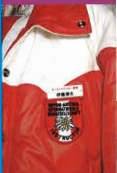
名品の系譜。好きだか ら、あげる。