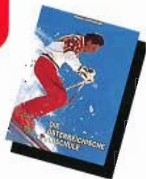
【新オーストリアスキー教程】

スキー王国オーストリアの 先進技術直伝だから、 どこに行っても鼻高々。 解る・感じる・浸み込ませる・ とき明す講習だから、 涙なしに楽勝上達。